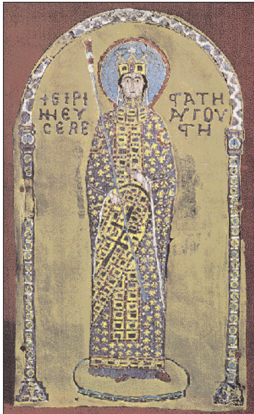
από την Κωνσταντινούπολη και αποτελούν μέρος της λείας που αποκόμισαν οι Βενετοί μετά την άλωση της Πόλης το 1204. Όταν το 1438 ο πατριάρχης της Κωνσταντινούπολης Ιωσήφ πέρασε από τη Βενετία μετέχοντας στη βυζαντινή αποστολή που πήρε μέρος στη Σύνοδο της Φερράρας - Φλωρεντίας, είδε την Pala d' Oro και βεβαίωσε ότι αρκετά από τα σμάλτα προέρχονταν από τον ναό του Παντοκράτορα της Κωνσταντινούπολης. Ανάμεσα στα σμάλτα υπήρχαν και οι εικόνες ενός Βυζαντινού αυτοκράτορα (Αλέξιος Α', Ιωάννης Β' ή Μανουήλ Κομνηνός) και της συζύγου του Ειρήνης. Κατά την ανακατασκευή της Pala d' Oro, το 1209, αφαιρέθηκε το κεφάλι του αυτοκράτορα και στη θέση του τοποθετήθηκε το κεφάλι του Βενετού δόγη με την αντίστοιχη λατινική επιγραφή, ενώ αφέθηκε άθικτη η εικόνα της αυτοκράτειρας.

θυστερημένα και με αργό ρυθμό στη Βενετία το καλοκαίρι του 1202. Ο αριθμός τους ήταν μικρότερος απ' ό,τι αναμενόταν, ο εξοπλισμός τους κακός, ακόμη χειρότερη η οργάνωση, και τα οικονομικά μέσα ανύπαρκτα. Κάποιοι από τους Σταυροφόρους είχαν έρθει σε επαφή με τον Αλέξιο, τον γιο του έκπτωτου Βυζαντινού αυτοκράτορα Ισαάκιου, που τους συνάντησε στη Βερόνα και ζήτησε τη βοήθειά τους με υπόσχεση ανταλλαγμάτων. Ωστόσο, τα ποικίλα προβλήματα που αντιμετώπιζαν οι Σταυροφόροι είχαν φέρει στα πρόθυρα της διάλυσης την όλη επιχείρηση. Η αδυναμία να ανταποκριθούν στις οικονομικές υποχρεώσεις προς τη Βενετία τους οδήγησε στη λύση της παροχής υπηρεσιών. Έτσι προσφέρθηκαν να βοηθήσουν τους Βενετούς στην ανακατάληψη της δαλματικής πόλης Ζάρα. Αποκλίνοντας από τον αρχικό σκοπό