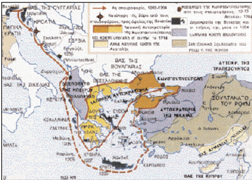
Χάρτης της Δ' Σταυροφορίας.

Η πρώτη Αλωση και η καταστροφή της Κωνσταντινούπολης από τους Σταυροφόρους το 1204