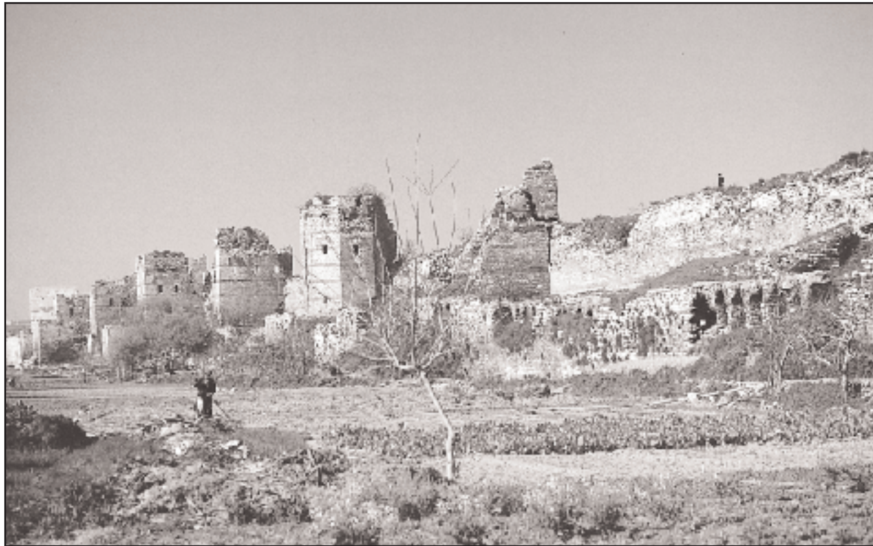
Το τριπλό θεοδοσιανό τείχος, στο ύψος της πύλης της Σηλυμβρίας – Πηγής. Το μεγαλύτερο οχυρωματικό έργο στον μεσαιωνικό κόσμο παρέμεινε άπαρτο για οκτώ αιώνες, προστατεύοντας τον Χριστιανισμό από ανατολώς κυρίως. Τραγική ειρωνεία πορθητές να είναι οι δυτικοί της Δ' Σταυροφορίας στις 13 Απριλίου 1204 (φωτ.: «Κωνσταντινούπολη. Αναζητώντας τη Βασιλεύουσα», εκδ. Λούση Μπρατζιώτη).

Παρ' όλα αυτά, η τάξη δεν αποκαταστάθηκε στην Κωνσταντινούπολη. Ήταν φανερό ότι η αυτοκρατορία ήταν δέσμη των Δυτικών, που φέρονταν με υπέρμετρη προκλητικότητα απέναντι στον πληθυσμό της Πόλης. Η παλιά εχθρότητα των Βυζαντινών προς τους Λατίνους όχι μόνο δεν εί-