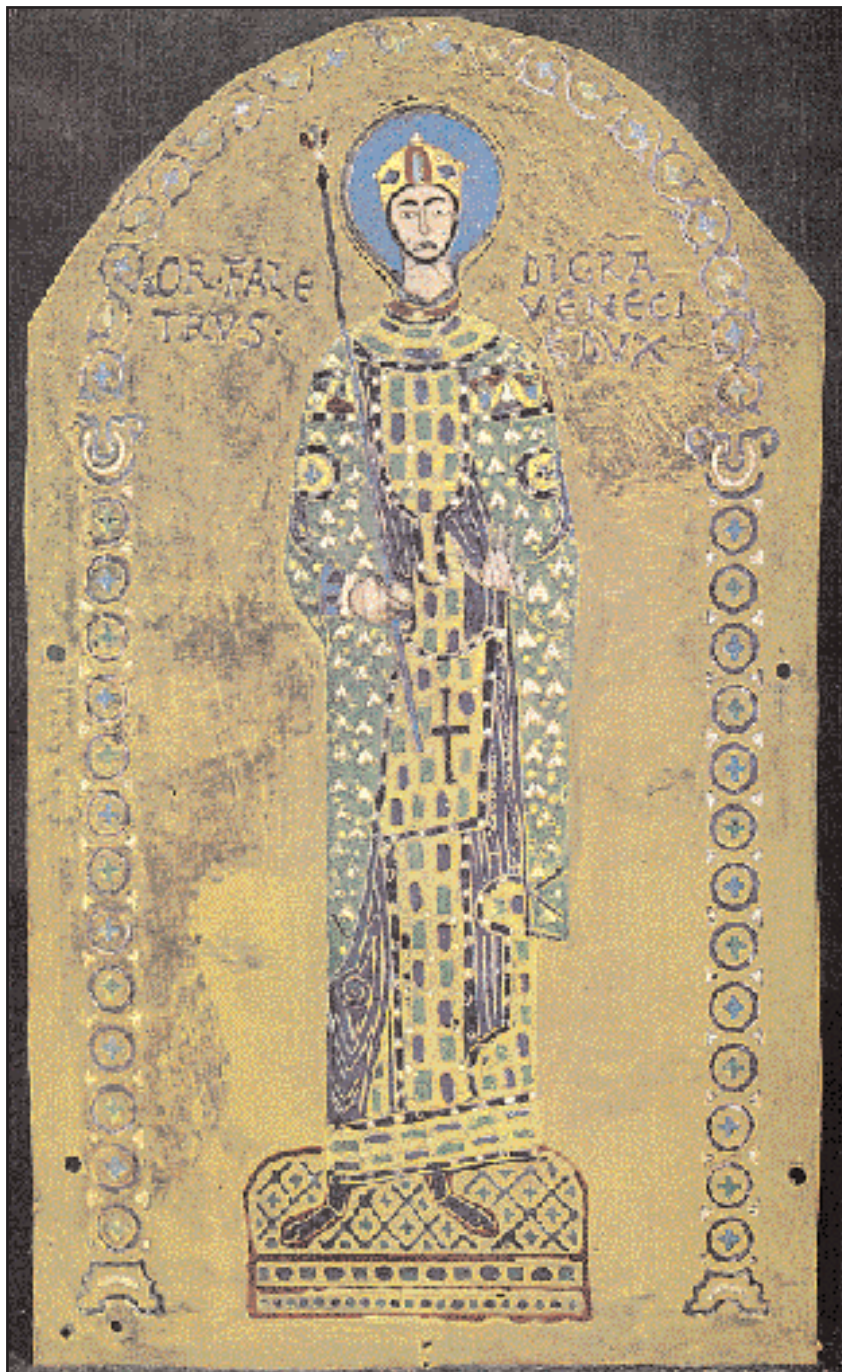
Ο Βενετός δόγης Ordelafo Falier (αριστερά) και η Βυζαντινή αυτοκράτειρα Ειρήνη (δεξιά). Εγχρωμα σμάλτα (12ος αι.), λεπτομέρειες από την περίφημη Pala d' Oro του Αγίου Μάρκου της Βενετίας. Κατασκευασμένο στις αρχές του 12ου αιώνα με παραγγελία του Δόγη Ordelafo Falier, το έργο δέχτηκε ουσιαστικές μετατροπές τον 13ο και τον 14ο αιώνα. Στη σημερινή του μορφή διατηρεί τα χαρακτηριστικά της τελευταίας δασκευής του (α' μισό του 14ου αιώνα) παρά τις πολλές μεταγενέστερες επεμβάσεις. Στην περίτεχνη χρυσή επιφάνεια (3,50x2,10 μέτρα) με τη γοθθικίζουσα μορφολογία, ποικιλμένη από 1.300 μαργαριτάρια και 1.200 περίπου πολύτιμες πέτρες, προβάλλονται 83 μεγάλες θρησκευτικές εικόνες από σμάλτο και πολυάριθμα «μετάλλια» ίδιας τεχνικής. Πολλά από τα σμάλτα (πιθανότατα και ο πολύτιμος διάκοσμος) προέρχονται

συμμετείχαν στην εκστρατεία, οι σταυροφόροι θα συγκεντρώνονταν στη Βενετία και από εκεί θα κατευθύνονταν κατά της Αιγύπτου ή της Συρίας. Τον Απρίλιο του 1201 οι εκπρόσωποι των Σταυροφόρων υπέγραψαν στη Βενετία τη σύμβαση της διαπεραιώσης του στρατεύματος στην Ανατολή. Οι Σταυροφόροι θα κατέβαλαν το ποσό των 85.000 μάρκων στους Βενετούς που αναλάμβαναν την υποχρέωση της μεταφοράς και της σίτισης των Σταυροφόρων για ένα έτος, παρέχοντας πενήντα γαλέρες και στρατιωτική δύναμη. Επιπρόσθετο όφελος για τη Βενετία θα ήταν η κατοχή του μισού των εδαφών που θα κατακτούσαν οι Σταυροφόροι.