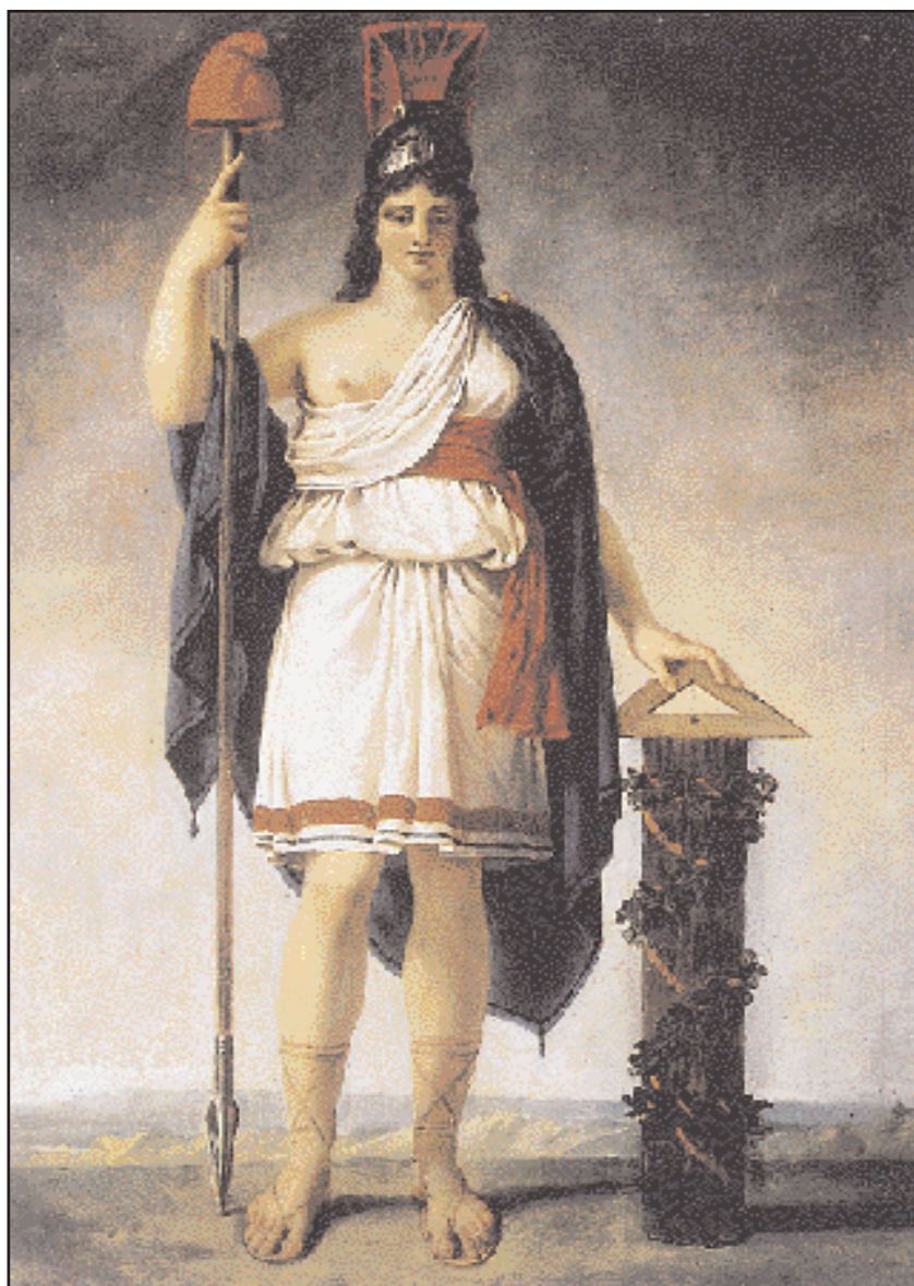
Αλληγορική μορφή της Δημοκρατίας. Πίνακας του Gros. Πύργος των Βερσαλλιών. Το πολιτικό καθεστώς της αθηναϊκής δημοκρατίας, εξιδανικευμένο απόλυτα, είχε διαποτίσει τα οράματα των Γάλλων επαναστατών και πρόσφερε την έμπνευση στην Τέχνη, το Λόγο, την Πολιτική. Γράφει ο Κοραΐς στον «Βίο» του: «Οι Γάλλοι (...) όμοιοι των Αθηναίων την σοφίαν, την ημερότητα, την φιλανθρωπίαν...».