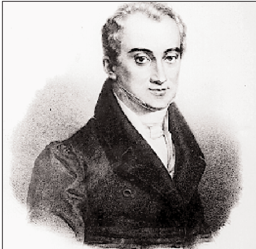
Λιθογραφική προσωπογραφία του Ιωάννη Καποδίστρια την εποχή που η Εθνοσυνέλευση της Τροιζήνας τον εξέλεξε Κυβερνήτη με ενισχυμένες εξουσίες. Ο Κοραΐς, ενώ είχε αρχικά επικροτήσει εκείνη την εκλογή, φοβούμενος το χειρότερο για τη δημοκρατία από τις υπερεξουσίες του Κυβερνήτη, στράφηκε σφόδρα εναντίον του (Εθνικό Ιστορικό Μουσείο).

Παρόμοιες ανησυχίες εκφράζει και για την τύχη του του νέου κράτους κατά τη διακυβέρνηση του Καποδίστρια. Παρ' όλο που αρχικά είχε επικροτήσει την εκλογή του ως κυβερνήτη, έβλεπε ότι λίγο αργότερα η σκληρή πραγματικότητα με τις ολοένα αυξανόμενες εσωτερικές συγκρούσεις παρεμπόδιζαν τη χρηστή και φιλελεύθερη διοίκηση. Επηρεασμένος και από τις οξυτάτες επικρί-