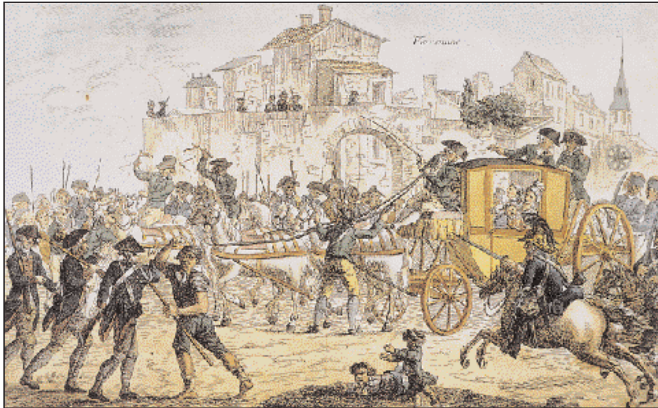
Η σύλληψη του Λουδοβίκου 16ου και της οικογένειάς του στις 21 Ιουλίου 1791, στη Βαρέν, ενώ επιχειρούσαν να αποδράσουν στο εξωτερικό για να υποκινήσουν ξένη επέμβαση προς ανατροπή του επαναστατικού καθεστώτος. Λαϊκή εικόνα. Μουσείο Καρναβαλέ, Παρίσι. «...Εις το φαινόμενον ελαφρόν έθνος τούτο εκρύπτετο μέγας αριθμός φιλοσόφων ανδρών, τους οποίους απεκάλυψεν (...) η κατάχρησις της τότε απολύτου μοναρχίας...», γράφει ο Κοραΐς.

Το περιεχόμενο των δέκα φυλλαδίων, για τα οποία θα γίνει λόγος εδώ, καθοδηγεί την παρουσίασή τους σε χρονολογική τάξη, αφού τα διαδοχικά θέματα που απασχόλησαν το συγγραφέα τους ακολουθούν και αυτά τη ροή του χρόνου. Πέντε από αυτά είναι γραμμένα σε μορφή διαλόγου. Και αυτό δεν είναι τυχαίο. Λογοτεχνικό είδος που χρησιμοποιήθηκε πολύ από τον Κοραΐ, ο διάλογος, διαμορφωμένος από την εποχή των σοφιστών, καλλιεργήθηκε έντονα στην περίοδο του Διαφωτισμού, του οποίου εξέφραζε το πνεύμα: διδακτικός χαρακτήρας, με διάθεση να πείθει, σε τόνους άλλοτε ήπιους και άλλοτε μαχητικούς. Τα στοιχεία του διαλόγου, άλλωστε, προσidiaζαν απόλυτα και στην ψυχοσύνθεση του Κοραΐ. Με την εναλλακτική επιχειρηματολογία που προβάλλονταν από τα δύο πρόσωπα του διαλόγου, η συμμετοχή του συγγραφέα γινόταν φαινομενικά έμμεση, ενώ ταυτόχρονα η επιδίωξη να φτάσει κανείς με αντικειμενικότητα στη συνισταμένη των απόψεων, στη λογική, έμοιαζε να πραγματοποιήσει με τρόπο πιο α-