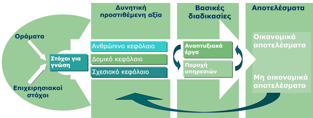
Σχήμα 1. Μοντέλο Αποτύπωσης του Διανοητικού Κεφαλαίου.

Το ακόλουθο διάγραμμα απεικονίζει όλα τα στοιχεία του μοντέλου, καθώς και τις ροές, με στόχο να εξηγήσει και να ερμηνεύσει τις διεργασίες.