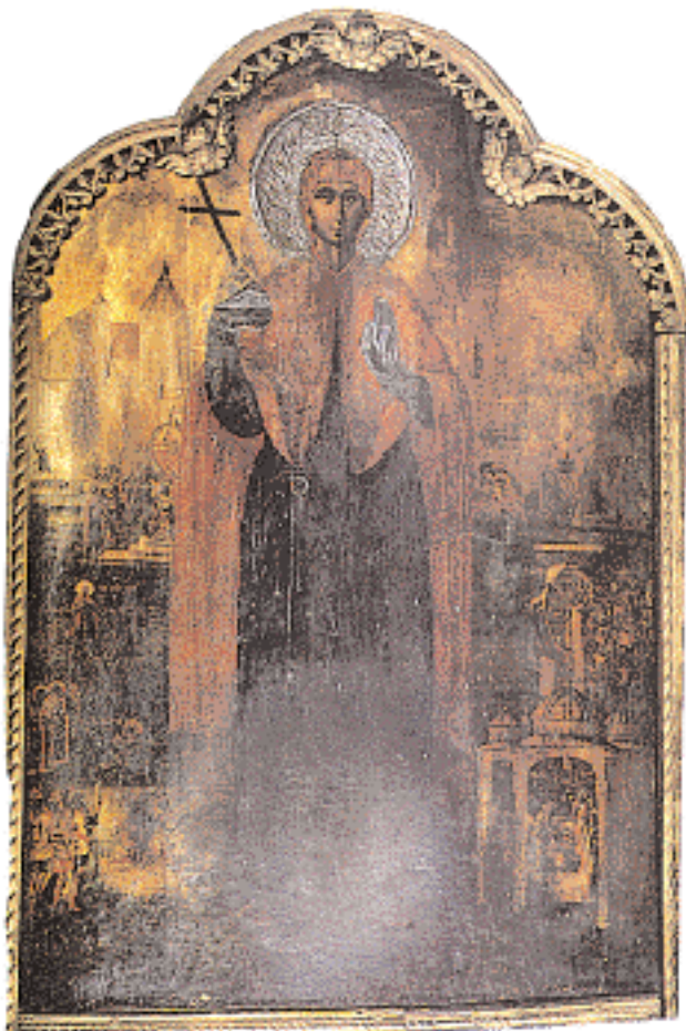
◀ Η Αγία Ευφημία. Εικόνα του ζωγράφου Ιεροθέου, 18ος αι., στον ναό του Αγίου Γεωργίου Οικουμενικό Πατριαρχείο, όπου φυλάσσονται και τα λείψανα της Αγίας (πηγή: «Το Οικουμενικό Πατριαρχείο», επιμ. έκδ. Α. Παλιούρας, Αθήνα-Γενεύη 1989).

λάζει για να μπει στην εποχή της φθινοπωρινής άπλοιας, όπως ορίζει το βυζαντινό απόφθεγμα «του Σταυρού σταύρωνε και δένε»– αποδίδουν την ευχή για τη διαφύλαξη και την αέναη επικράτηση της ίδιας της αυτοκρατορίας. Τον μήνα αυτό αντιβούσσε στην Κωνσταντινούπολη το αυτοκρατορικό πολυχρόνιο (ευχές για μακροβιότητα), στις επίσημες τελετουργίες κατά τις οποίες ο αυτοκράτορας έβγαινε από το Παλάτιο: κατά την 1η, αλλά και τις 8 Σεπτεμβρίου, εορτή του Γενέσιου της Θεοτόκου (κατεξοχήν εορτή του ναού των Χαλκοκρατείων), και έξι μέρες αργότερα (14 Σεπτ.), εορτή της Υψώσεως του Σταυρού στην Αγία Σοφία. Οι θριαμβοί της αυτοκρατορίας, που από τις αρχές της ζωής της έδειχναν να συνεχίζουν τους ρωμαϊκούς θριάμβους και να την προβάλλουν στο πέρασμα των αιώνων ως δυσάλωτη, ήταν άλλωστε ζυμωμένοι με τις ζωντανές μνήμες αλλά και τις ευχετήριες επευφημήσεις για την ακλυδώνιστη, όπως πιστευόταν, επικράτησή της επί παντός εχθρού.