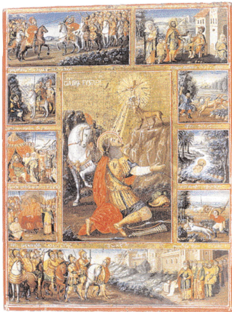
▲ Ο Άγιος Ενοιάθιος και σκηνές του βίου του. Στρατιωτικός επί Τραϊανού, όταν επιστρέφει, έχοντας στήσει «ρόπαια κατὰ των πολεμίων», στη Ρώμη, ο Ενοιάθιος ομίγει με την οικογένειά του, που είχε σωθεί θαυματουργικά από τα νερά ποταμού. Η λατρεία του Αγίου ήταν διαδεδομένη στην Καππαδοκία κατά τη μεσοβυζαντινή εποχή. Εικόνα του 1826, με καραμανλίδικες επιγραφές (πηγή: «Λιμάνια και καράβια στο Βυζαντινό Μουσείο». Εκδ. ΥΠΠΟ-ΤΑΠΑ, Αθήνα 1997).

Οι εορτασμοί για τις θριαμβικές διαβάσεις των υδάτων του Σεπτεμβρίου, του πρώτου, κατά το εκκλησιαστικό ημερολόγιο, μήνα του αείρου χρόνου της φύσης –ο οποίος τη μέρα αυτή αλ-