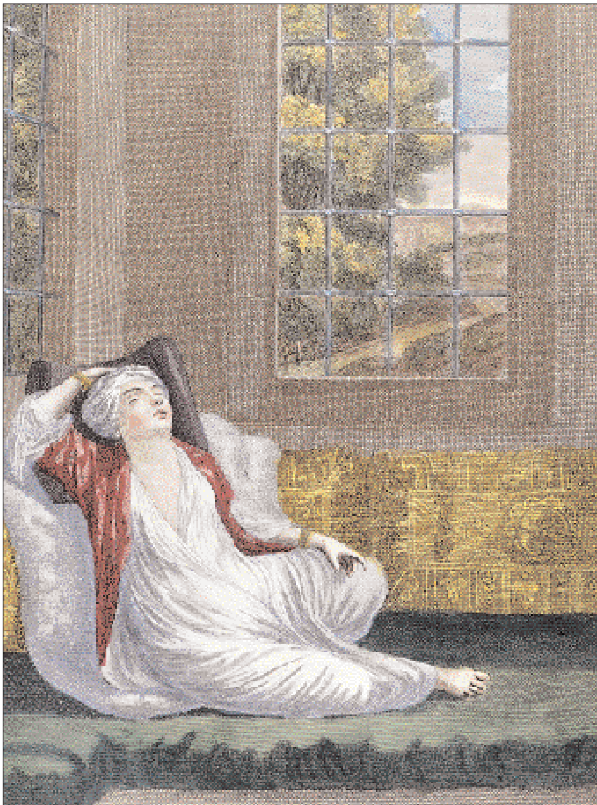
▲ «Γυναίκα μετά από το λουτρό, αφημένη στο νιβάνι», από το έργο: «Recueil de cent Estampes representant différentes Nations du Levant», Paris 1714.

είναι ανύπαρκτα. Σε μια εποχή, όπου μόλις εμφανίζονται διστακτικά τα πρώτα καφενεΐα, και αυτά απρόσιτα για τις γυναικείες συντροφίες, τα λουτρά, πολυάριθμα σε όλη την Αυτοκρατορία και επιβλητικά, ιδιαίτερα στην Κωνσταντινούπολη, αποτελούν έναν κατ' εξοχήν χώρο συνάντησης των ανθρώπων που συνυπήρχαν στην Οθωμανική Αυτοκρατορία, δείκτη των εκφράσεων και των αισθήσεών τους.