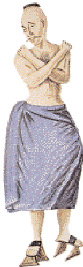
▲ «Αγόρι του λουτρού». Βοηθούσε τους πελάτες να πλυθούν στα δημόσια λουτρά. Τελιγμένος με πεσιόεια, φοράει τα ειδικά τούκαρα (takunya στα τουρκικά), για να μην γλιστρά στις σαπωννάδες. Ακουαρέλα Γάλλου καλλιτέχνη, περ. 1830 (πηγή: E. Petropoulos, «Album Ture», Παρίσι 1976).

Πολλές είναι οι μνείες που οι περιηγητές γινέσκεια, την κοινωνική, τις στάσεις και τις ριφορές που αναπτύσσονται μεταξύ των γυναικών λουτρά όταν αυτά αποσαν και συνδύαζαν τεμαντικότερο χώρο κάσμου και συνάθροιση. Όταν οι γυναίκες προνται στα λουτρά αφήνστην περιποίηση αι ακόλουθές τους και οτερο εύπορες στην τσία των γυναικών τούρου σε ένα τελετουργεπαναλαμβάνεται πάντονα, τυπολατρικά αίευχαρίστηση. Στο ύψηφνουν με το καλάθι διπλώνουν, αδειάζουνπραμάτεια που επιστρηγια την καθαριότητα, ...ομορφιά και την ψυχαγωγία τους. Το λούσιμο, η τριβή, η στελγίς, η βαφή, η αποτρίκωση, το πλέξιμο των μαλλιών, και η όλη περιποίηση προσώπου και σώματος, απορροφούν αρκετό χρόνο. Οσο διαρκεί αυτή η «τελετουργική κάθαρση» οι γυναίκες τραγουδούν ρυθμικά έναν σκοπό που αντηχεί ως έξω στον δρόμο σημειώνει ο J. Dallaway (1795). Συνεχίζουν αργόσυρτα και ανέμελα, με όλα τους τα ψιμύθια και τα άλλα σέμερα, τον καλλωπισμό τους [A. L. Castellan (1797)] και συνακόλουθα και την ψυχαγωγία τους όπως ορισμένες φορές οι κυρίες «κλείνουν τις αίθουσες και παρακολουθούν θέατρο σκιών» [G. A. Olivier (1796)]. Η