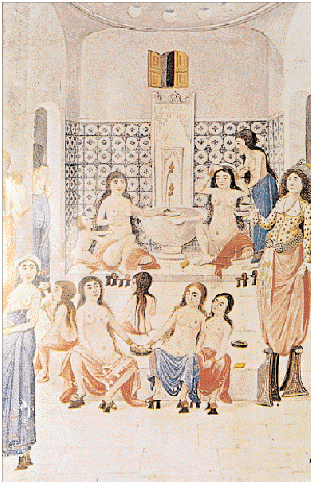
▲ «...Όλες βρίσκονταν σε φνοική κατάσταση, δηλαδή ολόγυμνες, αποκαλύπτοντας καθεύ όμορφο και κάθε ελάττωμα που είχαν. Ωστόσο δεν υπήρχε ούτε το παραμικρό πρόσχημο χαμόγελο ή άοεμνη χειρονομία ανάμεσά τους...», Lady Montagu, 1717. «Γυναικείο λουτρό», οθωμανική μικρογραφία, 18ος αι. Κεντρική Βιβλιοθήκη Πανεπιστημίου Κωνσταντινούπολης.

Όταν τα ταξίδια στον οθωμανικό κόσμο και οι εκδόσεις των περιηγητικών εντυπώσεων πυκνώνουν, από τον 16ο αι. και εξής, η Κωνσταντινούπολη, με την εδραίωση της Οθωμανικής Αυτοκρατορίας, γίνεται πόλος έλξης για τους Δυτικούς— διπλωμάτες και εμπόρους— που διαμένουν εκεί για να συνάψουν συμφωνίες και να γνωρίσουν τις συνήθειες και τους δεσμούς των εθνοτήτων. Τότε τα λουτρά χρησιμοποιούνται από πολλούς περιηγητές σαν ένα κλειδί που τους δίνει την ευχέρεια να παρεισφρήσουν και να περιπλανηθούν σε αυτούς τους χώρους, να έλθουν σε τριβή και να γνωρίσουν έναν άλλο κόσμο, να συκνωτιστούν με τις άλλες εθνοότητες, σε άγνωστους τόπους, με άγνωστες γλώσσες και να αφεθούν στα χέρια των λουτράρηδων. Τα διαχωριστικά όρια, κοινωνικά και θρησκευτικά σε αυτούς τους χώρους