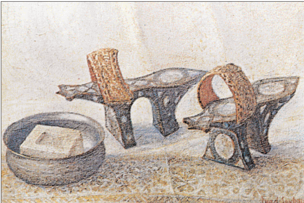
◀ Το μεταλλικό τάσι –σε σχήμα αρχαίας φιάλης– και τα ψηλοτάκουνα ξύλινα τούκαρα με τις φιλιωμένες διακοσμήσεις αποτελούσαν αναπόσπαστα σέμερα της μέθεξης και της διαδικασίας του λουτρού.

να σημειώσουμε ότι αποδίδουν την ικανότητα που έχουν οι Τούρκοι να κάθονται ή να κοιμούνται στο πάτωμα, στη γυμναστική στην οποία αφήνονται στα λουτρά [G.Postel (1560)]. Τα συνιστούν στους ηλικιωμένους, εξ ιδίας πείρας, σημειώνοντας ότι η επιδρωση όπως επίσης και η τριβή και η στελγίς με το ειδικό σφουγγάρι βοηθούν στο άνοιγμα των πόρων [P.A. Guys (1783), G.Postel]. Πολλοί Αγγλοι αν και παραδέχονται τα θεραπευτικά αποτελέσματα από την πρακτική αυτή, νοιώθουν δύσπνοια στους κλειστούς, υπέρθερμους και συχνά με αναθυμιάσεις χώρους αυτούς και γι' αυτό προτιμούν τα θαλάσσια μπάνια... Δηλώνεται ότι αν και πρέπει να αποφεύγονται σε περιόδους επιδημιών συνιστώνται για την πρόληψη και καταπολέμηση αφροδισίων νοσημάτων [Rouillet (1657), Lambert de Saumery (1731)]. Ίσως για όλους αυτούς τους λόγους, δεν είναι τυχαίο, που ο τελευταίος προτείνει ότι με την κοσμοσυρροή που παρατηρείται στα λουτρά, ενδεικνύεται, οι προσερχόμενοι να ειδοποιούν από την προηγούμενη για να κλείσουν θέρση... Τα λουτρά είναι ανοικτά, από τις 4 το πρωί ως τις 8 το βράδυ.