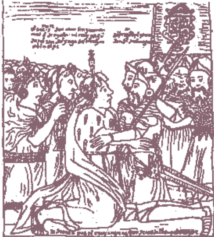
▲ Ο πρώτος πρεσβευτής του Ινκα Ουασκάρ σονταντάι με τους Ισπανούς.