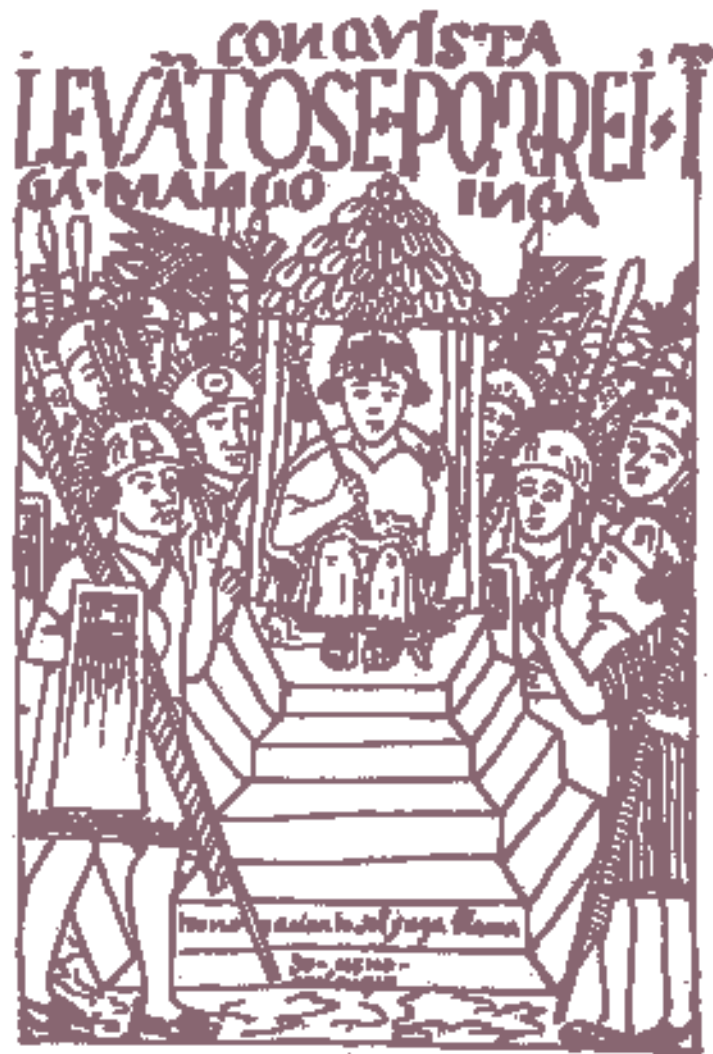
▲ Ανακήρυξη του Μάνκο Ινκα αυτοκράτορα στο Κούσκο.