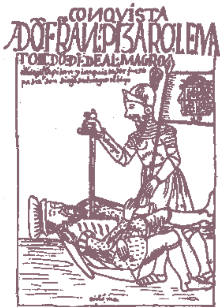
▲ Ο Πιζάρο σκοτώνει τον Αλμάγρο.

Αρκετές εικασίες έχουν γίνει για τη δυστοκία του πυροβολικού του Πέτρου του Κρητικού την κρίσιμη ώρα της μάχης, γεγονός που απέβη καθοριστικό στην έκβασή της. Σύμφωνα με