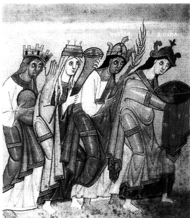
Οι υποτελείς στον Όθωνα Γ΄ χώρες (Γερμανία-Σκλαβηνία-Γαλλία-Ρώμη). Από χειρόγραφο της Εθνικής Βιβλιοθήκης Μονάχου.

από μια πρεσβεία που έστειλε αργότερα (μάλλον το 1029) στον νέο αυτοκράτορα της Γερμανίας Κονράδο Β΄ (1024-1039) ο αυτοκράτορας Ρωμανός Γ΄, τα