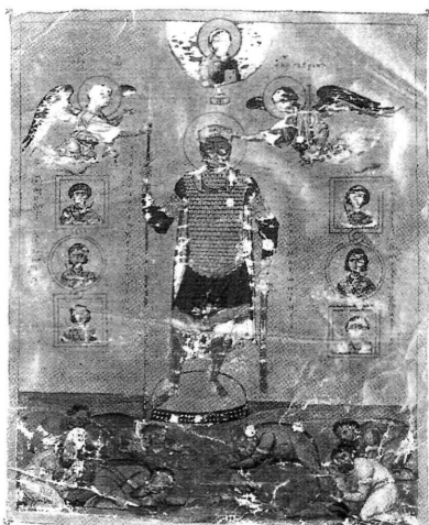
Βασίλειος Β΄, ο επανομαζόμενος “Βουλγαροκτόνος” (976-1025) με υποτελείς άρχοντες, από χειρόγραφο της Μαρκιανής Βιβλιοθήκης, Βενετία.