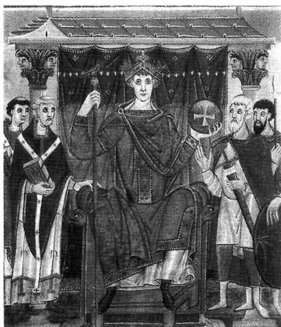
Όθων Γ΄, ο επανομαζόμενος “genere graecus, imperio Romanus” (983-1002).