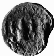
Εικόνα 4-6. Λυχνάρια με την παράσταση του Ἄττη από τις ανασκαφές της Πάτρας.