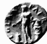
Εικόνα 2. Πάτρα. Μάρκος Αυρήλιος.