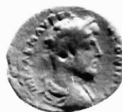
Εικόνα 1 α-στ. Πάτρα. «Ψευδο-αυτόνομες» κοπές.