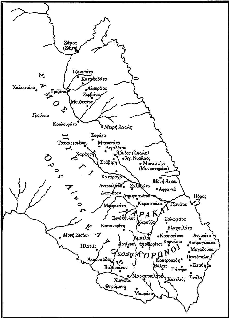
Χάρτης της νοτιοανατολικής Κεφαλονιάς (Πυργί - Αράκλι - Κορωνοί - Ελιός)