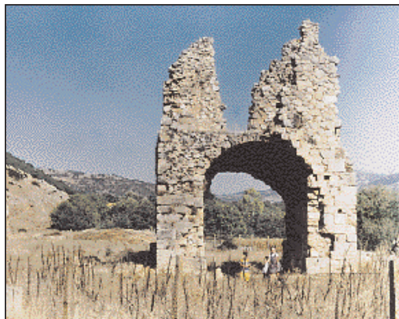
Σε μικρή απόσταση, ΒΔ της αρχαίας Στυμφάλου, στο χωριό Στυμφαλία Κορινθίας, υψώνονται τα ερείπια της φραγκικής μονής του Ζαρακά, του τάγματος των κιστερκιανών μοναχών (αρχές του 13ου αι.). Από το συγκρότημα του μοναστηριού σώζονται τα ερείπια της μεγάλης εκκλησίας και ένας πύργος, στο ισόγειο του οποίου υπήρχε η είσοδος του μοναστηριού.

Θεόδωρος Αγγελος. Το 1387, ύστερα από τετράχρονη πολιορκία, η Θεσσαλονίκη καταλήφθηκε από τους Τούρκους, αλλά το 1403 ανακτήθηκε από τους Βυζαντινούς. Μετά είκοσι χρόνια παραχωρήθηκε με τη συγκατάθεση του πληθυσμού στους Βενετούς έως το 1430, οπότε την κατέλαβαν οριστικά οι Τούρκοι.