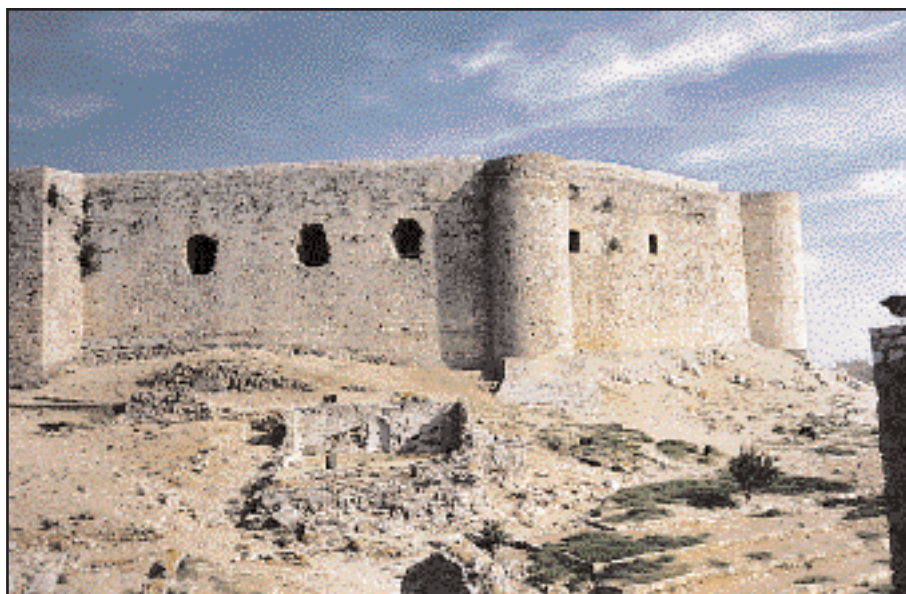
Το φρούριο του Χλεμουσιού (Castel Tornese). Αποψη του εσωτερικού από ανατολικά. Χτίστηκε από τον Γοδεφρείδο Βιλλαρδουίνο, ανιψιό του χρονικογράφου της Δ' Σταυροφορίας. Είναι από τα λίγα που κτίστηκαν από την αρχή σε θέσεις που έκριναν σημαντικές οι Φράγκοι. Για την κατασκευή του χρησιμοποιήθηκε υλικό που βρέθηκε επί τόπου ή μεταφέρθηκε από γειτονικές περιοχές. Για την οικοδόμησή του εργάστηκαν ανειδίκευτοι ντόπιοι τεχνίτες. Τα ερείπια του φρουρίου σώζονται πάνω από το χωριό Κάστρο, κοντά στην Κυλλήνη της Ηλείας.