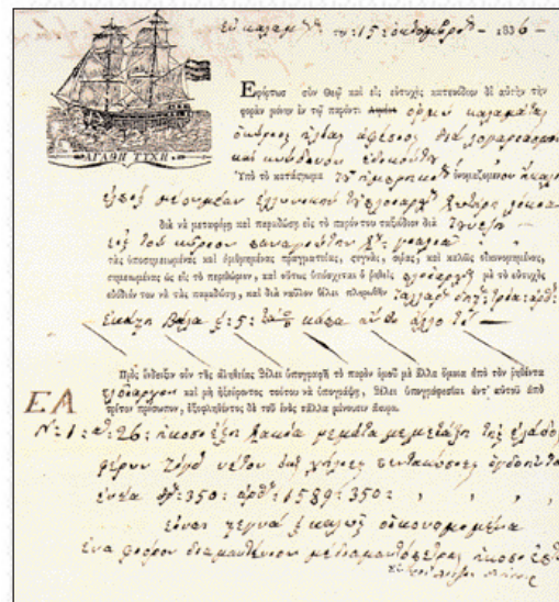
▲ Φορτωτική του Η. Εφέσιου, με χρονολογία 1836 από την Καλαμάτα, για παράδοση αγροτικών προϊόντων στην Τυνησία (Ιδιωτικό αρχείο οικογένειας Εφέσιου).

4. Οι πληροφορίες προέρχονται από τα: «Πανελλήνιον Λευκόμα Εθνικής Εκατονταετηρίδος 1821-1921», τ. Α', Αθήνα 1921, και «Το ελληνικό χαρτονομίσμα από το 1828 έως σήμερα», έκδ. Τράπεζα Πίστεως, 1979.