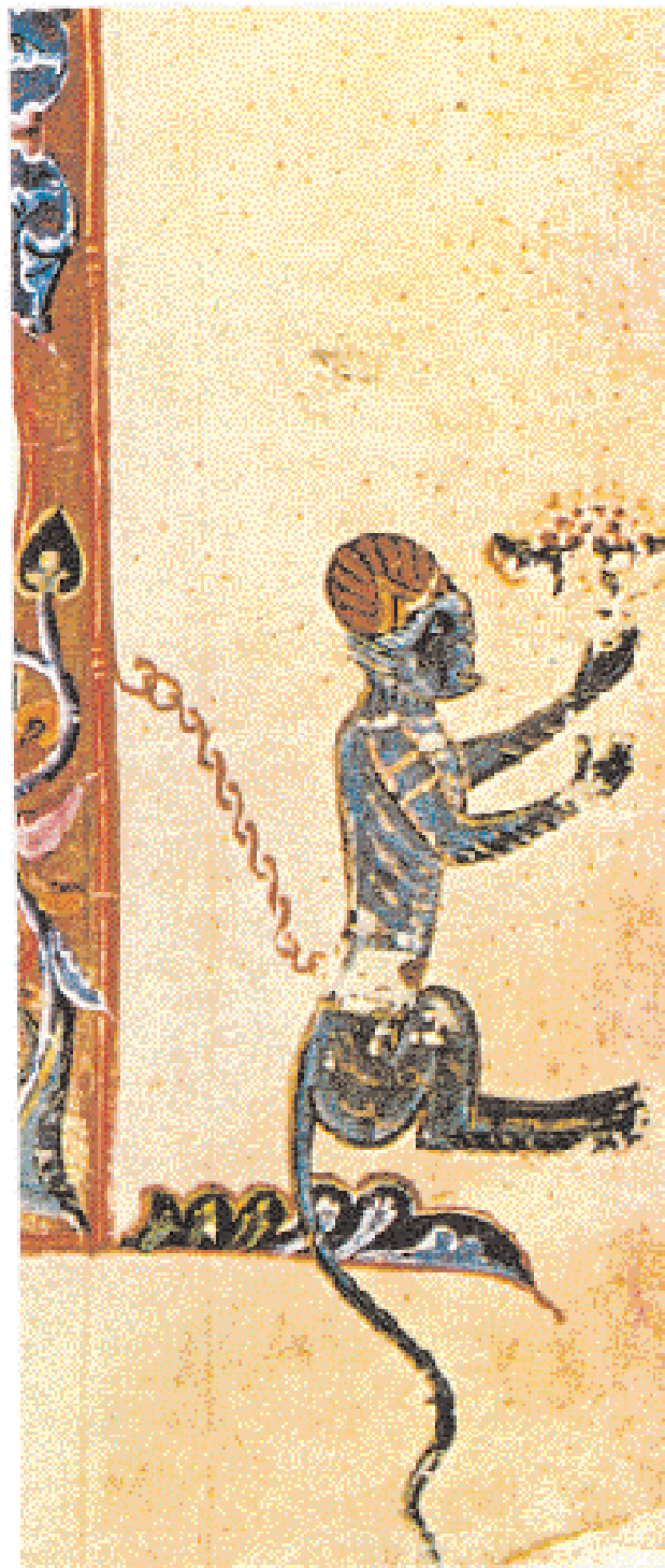
◀ Αλεπού και μαϊμού σε περιθώρια φέλλων Τετραεγγέλου 13ου αι. Μετά τον 11ο αι. στη θρησκευτική τέχνη εισβάλλουν διακοσμητικά θέματα από λαϊκούς ή και αισώπειους μύθους για ζώα, γεγονός που δηλώνει μια διστακτική έκφραση του δημόδους και μια απόδραση από το θρησκευτικό στο χώρο των εντράπελων, αποτροπαϊκού και μαγικού (Μονή Διονυσίου).

της πολιτείας, οι εκπρόσωποι της στρατιωτικής αριστοκρατίας που έχουν γίνει καθεστρωκία τάξι επιδιώκουν να προσθέσουν στην περιουσία τους αγαθά πολιτισμού. Η τάση είναι ομοιογενής και ομοιόμορφη: όλοι οι παράγοντες του κράτους και της κοινωνίας αναζητούν την επανασύνδεση με ένα παρελθόν αυτοκρατορικής αίγλης, το οποίο εκφράζεται πολύ πειστικά στην καλλιτεχνική (φιλολογική και εικαστική) παραγωγή ελληνιστικών και των ελληνορωμαϊκών χρόνων. Οι λόγιοι της εποχής, αυλικοί και ιερωμένοι, καλούνται να μορφοποιήσουν τα αιτούμενα της κοινωνίας και επιλέγεται η μίμηση. Μίμηση πράγματι, αλλά μίμηση λειτουργική και ιδιαίτερα δημιουργική.