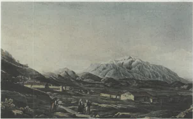
Αποψη του Ολύμπου από χαλκογραφία έκδοσης του Ed. Dodwell

ουν τις δυσχέρειες. Ανάλογες δυσκολίες υπήρξαν και στον νησιωτικό χώρο, εκεί όμως η αδιάκοπη παρουσία του ελληνικού στόλου αποκαθιστούσε μία υδάτινη ενιαία περιοχή κυριαρχίας.