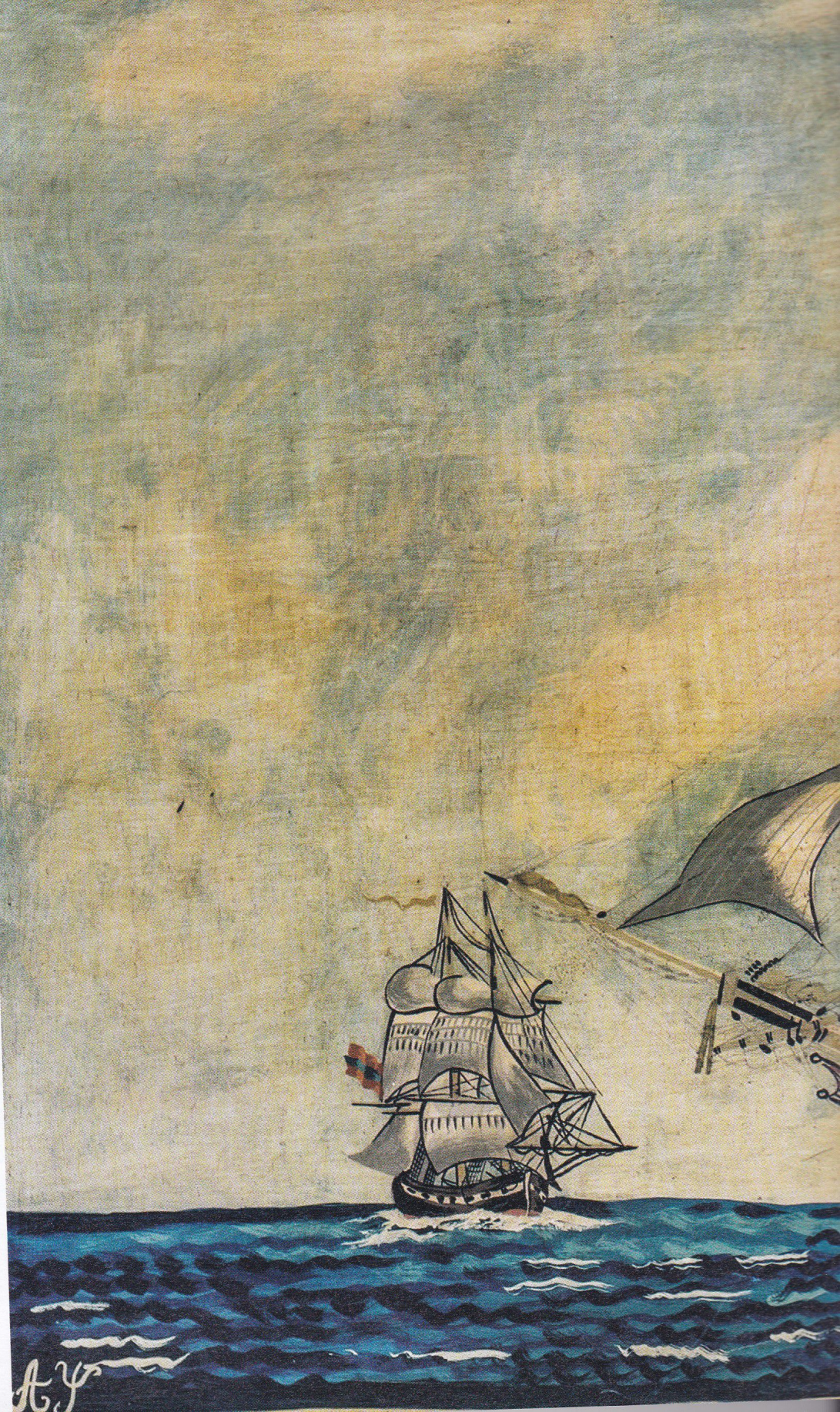
ΤΕΡΨΙΧΟΡΗ Η γολέτα Τερψιχόρη των Εμμανουήλ και Ιάκωβου Τομπάζη (Πολεμικό Μουσείο, Αθήνα).