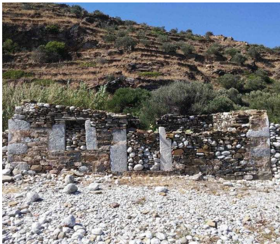
Εικ. 3. Αρχαία Καινίπολις, άποψη του παράλιου οικισμού.