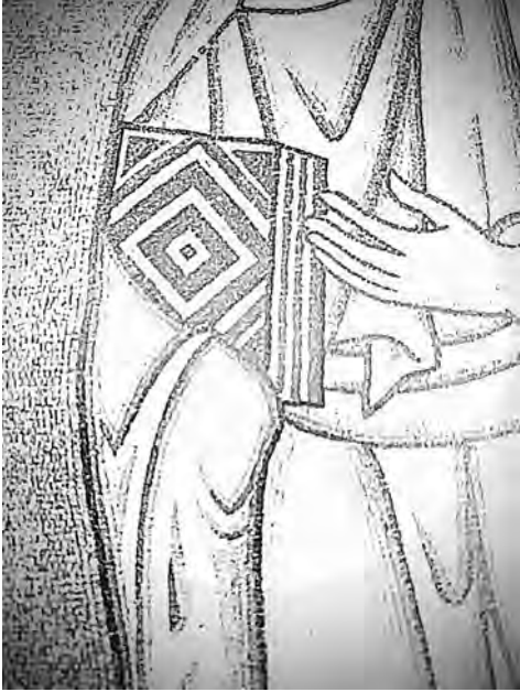
Fig. 2: Croquis du livre tenu par saint Paul dans la mosaïque de Hosios Loukas, XI e siècle. Croquis d'après l'original par Véronique Magnès et DL.

et jusqu'au VII e siècle, comme cela transparaît dans les monuments du nord de l'Italie et de Rome 27 .