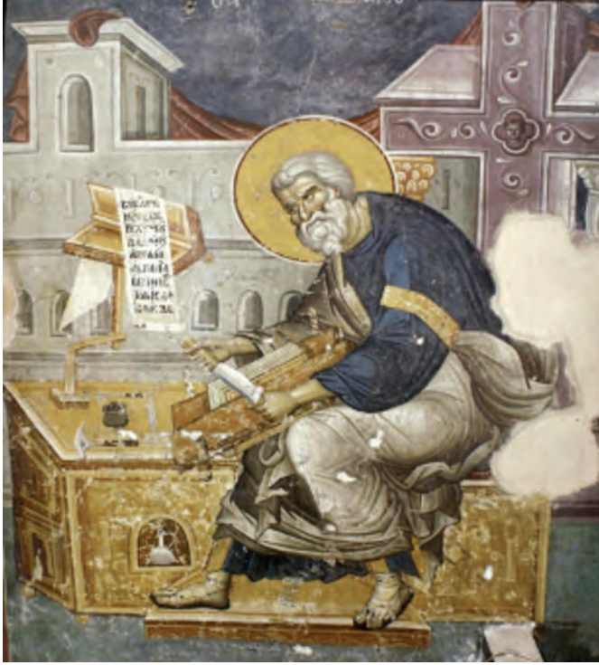
Fig. 5: Saint Mathieu comme relieur. Église de Protaton, Mont Athos.