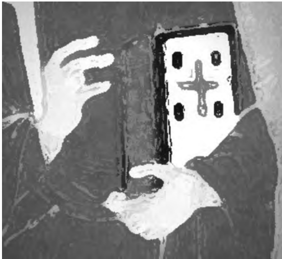
Fig. 6: Croquis d'un détail du livre tenu par le Christ sur le plat de l'Évangélaire de la Bibliothèque Marciana. Croquis d'après l'original par Véronique Magnès et DL.