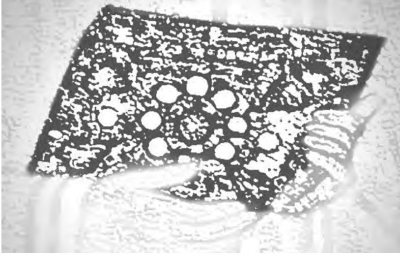
Fig. 4 : Croquis de l'Évangile dans les mosaïques impériaux de Ravenne, VI e siècle Croquis d'après l'original par Véronique Magnès et DL.

vant son pouvoir d'en-haut 30 . L'évangélaire est décoré de pierres précieuses et le motif central, présentant une variation, devient ici floral, avec des pétales en perles entourés qui forment des éléments décoratifs places aux quatre coins du livre, de couleur verte, qui figurent probablement des émeraudes (fig. 4). Les mêmes teintes sont utilisées pour les pierres précieuses décorant la croix que tient l'évêque dans sa main droite. Au sein de la composition, l'évangélaire, la croix et la broche de l'empereur attirent le regard du spectateur en tant qu'éléments d'un thème unique soulignant avec magnificence le prestige de la puissance sacerdotale et politique, et le liant à la représentation de l'Évangile.