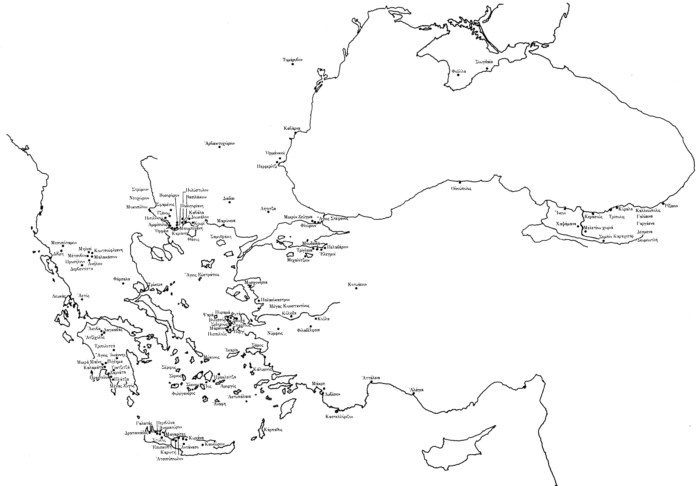
Δ' Χάρτης τῶν πατριαρχικῶν ἐξουχιῶν