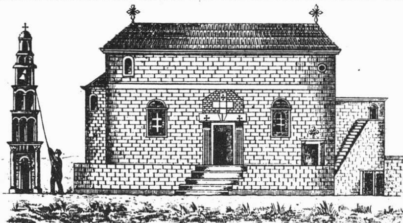
Ο ΕΝ ΖΙΛΑΗ: (ΣΥΛΑΤΑ) ΑΡΧΑΙΟΤΑΤΟΣ ΝΑΟΣ (1080) ΤΟΥ ΑΓΙΟΥ ΜΕΓΑΛΟΜΑΡΤΥΡΟΣ ΓΕΩΡΓΙΟΥ, Ο ΝΥΝ ΕΠΙΣΚΕΥΑΣΘΕΙΣ (1907).

Ὡς τῶν αἰχμαλώτων ὁ ἐλευθερωτὴς καὶ τῶν πτωχῶν ὑπερασπιστὴς, ἀσθενούντων ἰατρός, βασιλέων ὑπέρμαχος, Τροπαιοφόρος Μεγαλομάρτυς Γεώργιε, πρόσβευε Χριστῷ τῷ Θεῷ σωθῆναι τὰς ψυχὰς ἡμῶν.