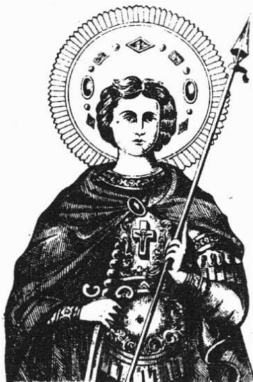
Ο ΑΓΙΟΣ ΓΕΩΡΓΙΟΣ

Ὡς τῶν αἰχμαλώτων ὁ ἐλευθερωτὴς καὶ τῶν πτωχῶν ὑπερασπιστὴς, ἀσθενούντων ἰατρός, βασιλέων ὑπέρμαχος, Τροπαιοφόρος Μεγαλομάρτυς Γεώργιε, πρόσβευε Χριστῷ τῷ Θεῷ σωθῆναι τὰς ψυχὰς ἡμῶν.