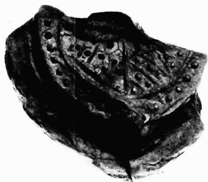
Εικόνα 3. Ολυμπία, αρ. Κ 4025, ΔΑΙ Athen, Neg. Nr 88/871.