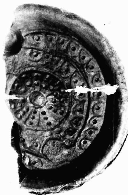
Εικόνα 2. Ολυμπία, αρ. Κ 4024, ΔΑΙ Athen, Neg. Nr 88/869.