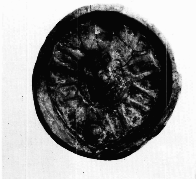
Εικόνα 1. Ολυμπία, αρ. Κ 4026.