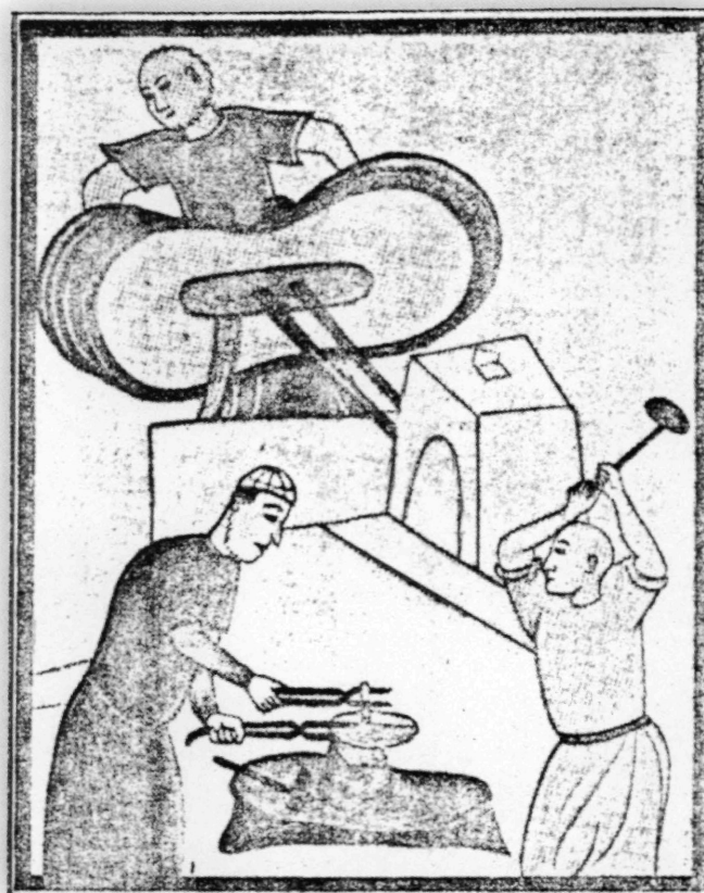
Εικ. 2: Κοπή του παρά με τη μέθοδο του σφυριού σε οθωμανικό νομισματοκοπείο (από μινιατούρα του 15ου αιώνα).

Το φραντζέζικο φλωρί, το χρυσό λουδοβίκι (λοβίκι) θα κυκλοφορήσει στο πρώτο μισό του 17ου αι., ενώ το χρυσό ναπολεόνι θα το συναντήσουμε στην Ανατολή πολύ αργότερα, μόλις στις αρχές του 19ου αιώνα. Μεγάλη διάδοση είχαν οι ισπανικές, πορτογαλικές και γενουάτικες δούπιες (ντούμπλες) και ντουμπλόνια και τα μισά των νομισμάτων αυτών. Αραιότερα συναντάμε στις πηγές τη χρήση και κάποιων άλλων ευρωπαϊκών χρυσών νομισμάτων: το αυστριακό σοφερίνι (ή σοφρόνι), γνωστό και ως κρεμέζικο ή φλωρί βασιλι-