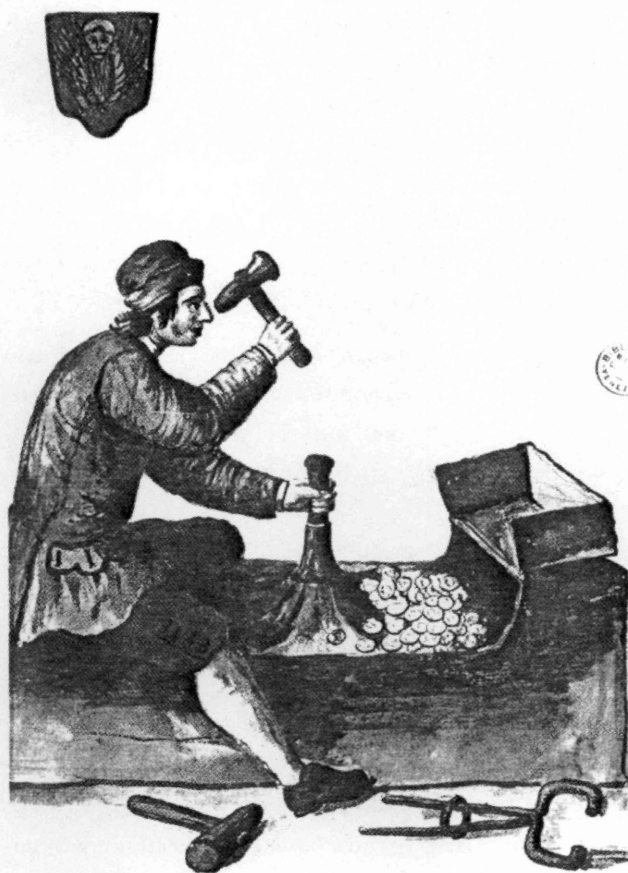
Εικ. 8: Κοπή βενετσιάνικων νομισμάτων με σφυρί (18ος αιώνας), (Ιστορία του Ελληνικού Έθνους, τ. 11, σ. 185).

αλλά αυτό δεν εμποδίζει την εξάπλωση και διαιώνιση του φαινομένου.