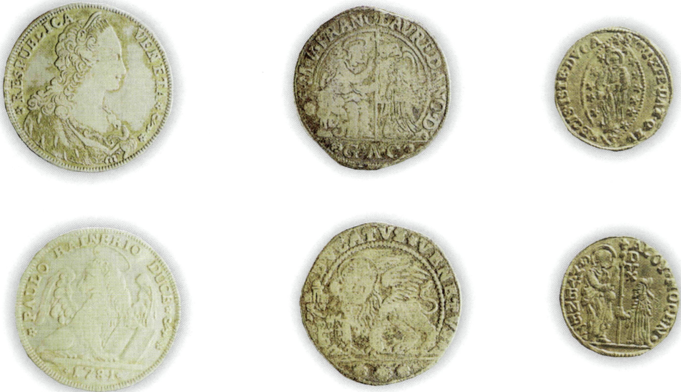
Εικ. 3: Βενετσιάνικα νομίσματα του 18ου αιώνα: ασημένιο τάλιρο (αριστερά), ασημένιο δουκάτο (κέντρο), χρυσό δουκάτο ή τσεκίνι (δεξιά).

κό· το φλωρεντινό φλωρίνι και το τριπλάσιό του ρου- σπόνι ή ροσπόνι. Κι ακόμα σπανιότερα: ρώσικα ρούπλια και ρωμάνικα, μάρκα γερμανικά (τ'αλμάρκα) και κάποτε τα γαλλικά sequins du roi.