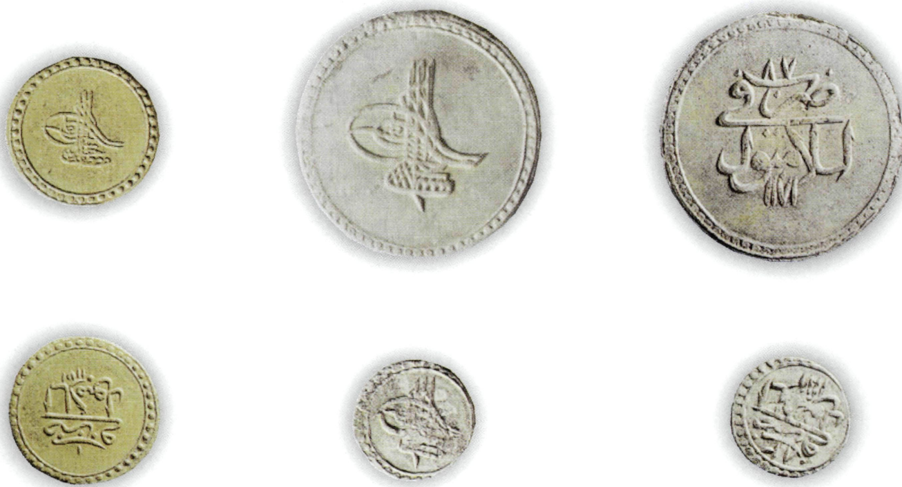
Εικ. 1: Οθωμανικά νομίσματα της περιόδου Μουσταφά Γ' (1757-1774): Χρυσό altun (αριστερά κάθετα), ασημένιο γρόσι (επάνω οριζόντια), ασημένιος παράς (κάτω οριζόντια).

μιλάμε για ζώνες –και λιγότερο για εποχές– τούτου ή εκείνου του νομίσματος. Σε μια προσπάθεια πάντως ενός χωροχρονικού προσδιορισμού –πολύ γενικού, πολύ σχηματικού– θα μπορούσαμε να πούμε ότι τα οθωμανικά νομίσματα, καθώς είναι αυτονόητο, έχουν μεγαλύτερη κυκλοφορία στις τουρκοκρατούμενες περιοχές, τα βενετσιάνικα καταβάλλεται μέριμνα από τις Αρχές να επιβληθούν στις βενετικές κτήσεις με τάση ταυτόχρονα να επεκταθούν και στις οθωμανικές,